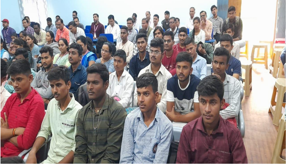
उपस्थित कनिष्ठ व वरिष्ठ महाविद्यालयाचे विद्यार्थी, शिक्षक व पालक