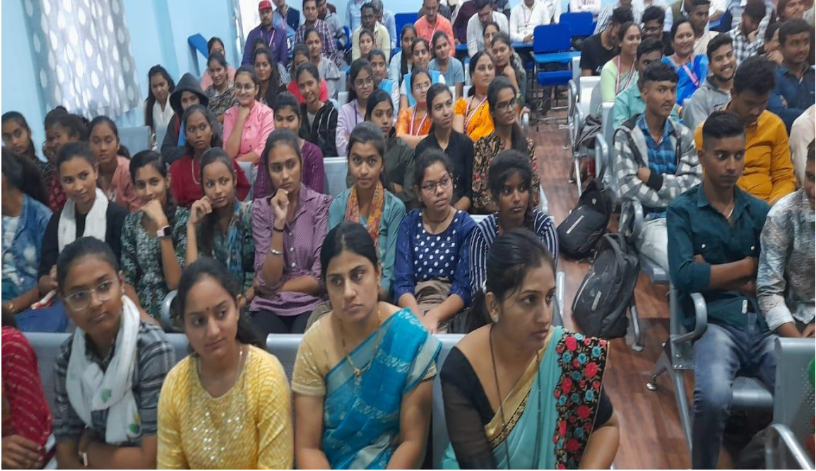
उपस्थित कनिष्ठ व वरिष्ठ महाविद्यालयाचे विद्यार्थी, शिक्षक व पालक